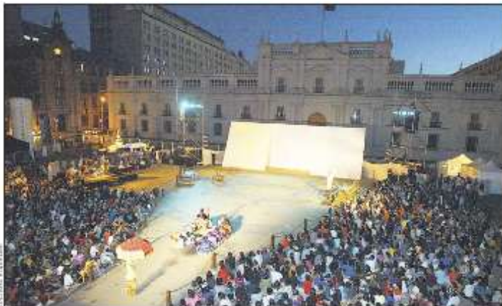
MALASANGRE -2010

También es en 2010, en el marco de la conmemoración de bicentenario de la República de Chile y a petición del Festival Internacional de Teatro Santiago a Mil, se restaura una de las primeras creaciones de Compañía, una de sus obras emblemáticas: « Malasangre o las 1001 noches del Poeta », inspirada en la vida del poeta visionario francés, Arthur Rimbaud. Juntando un elenco de jóvenes y talentosos artistas chilenos que se presentaron con un gran éxito para más de 35.000 espectadores, entre 2010 y 2012.