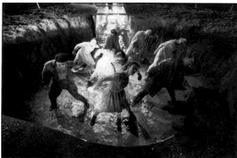
ALICE UNDERGROUND - 1999

El año 1999 inicia una nueva etapa en la historia de la Compañía: el Teatro del Silencio es invitado a instalarse en residencia artística en la Región Auvergne, en Francia, en la comuna de Aurillac : “Capital Mundial de las Artes Callejeras” y donde residirá durante 12 años, hasta 2010. Gracias al doble apoyo del Ministerio de la Cultura y Comunicación / Dirección Regional de Asuntos Culturales de Auvergne (DRAC Auvergne), de la Municipalidad d’Aurillac, de su Teatro en complicidad con el Festival d’Aurillac.