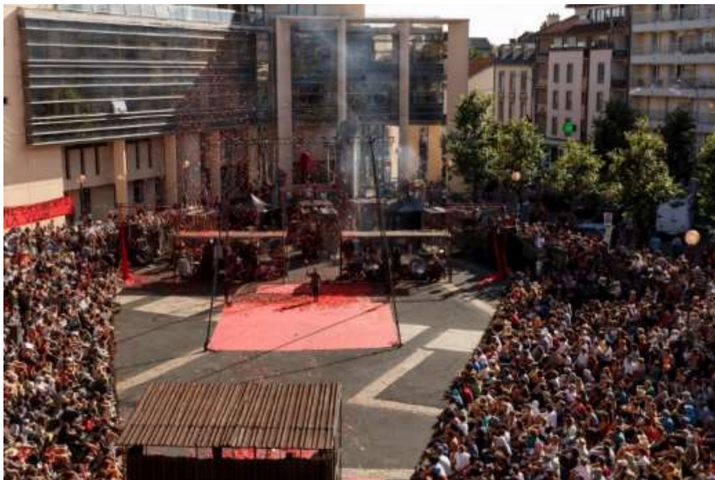
DOCTOR DAPERTUTTO - 2014

En esta búsqueda, en 2014, la Cía. crea « DOCTOR DAPERTUTTO », una obra, inspirada en la vida y obras del inmenso director de Teatro ruso Vsevolod Meyerhold, asesinado bajo el régimen de Stalin. Un espectáculo en dos actos, combinando un espectáculo de teatro-circo fijo al aire libre y un Itinerante-pasacalle participativo. El díptico « DOCTOR DAPERTUTTO », será presentado entre 2014 y 2017, en Francia, en España, Holanda y en Chile. Y premiado en España.