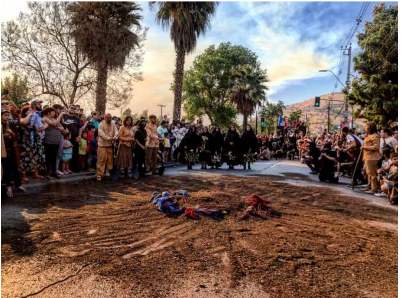
«Renca Despertó» - 2019