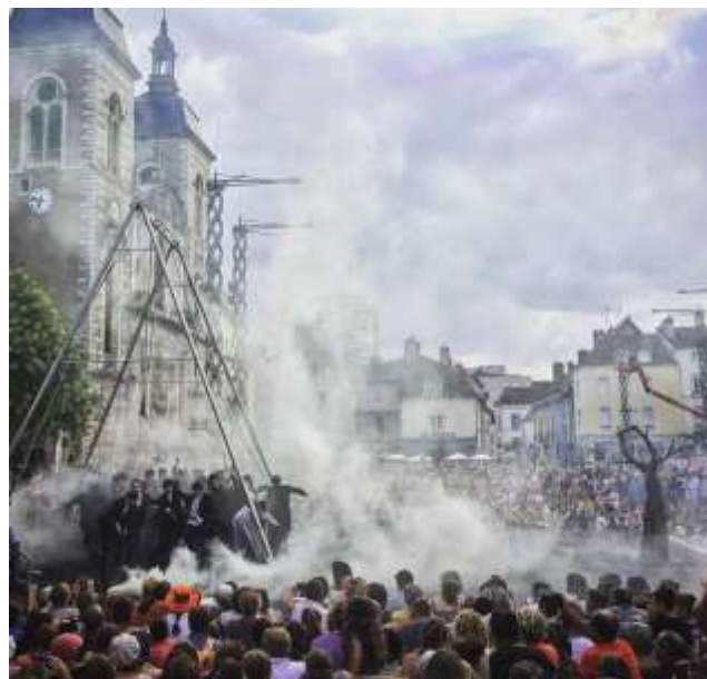
RUMBO AL CEMENTERIO – Chalons-sur-Soane - 2018

En 2017, el Teatro del Silencio, bajo la dirección de Mauricio Celedón, crea un nuevo díptico callejero: « ¡OH! SOCORRO » - espectáculo Teatro-Circo al Aire libre - y « RUMBO AL CEMENTERIO » - un itinerante participativo. Una inmersión en el universo de Samuel Beckett libremente inspirado en el dialogo poético « Beckett y Godot » del gran dramaturgo chileno Juan Radrigán, fallecido en octubre 2016. Dos obras creadas entre tres continentes, en Francia, Argelia y Chile; y que fueron presentadas entre 2017 y 2019 en destacados festivales de Teatro de Calles en Francia, España, Holanda y Republica de Corea. En Chile la Cía. fue invitada con las dos obras, a celebrar los 25 años del Festival Santiago a Mil y a una residencia de formación en el Parque Cultural de Valparaíso con ochenta participantes.