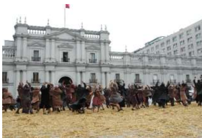
Seminario Purgatorio desde Su Interior - 2005

En 2005, dirige el Seminario Internacional: "Purgatorio desde su Código Interior " gracias al apoyo del Centro Cultural Matucana 100 y el Gobierno de Chile Fondart 2005, que reúne más de cien alumnos en laboratorios multidisciplinares y será finalizado con un pasacalle e intervención desde Matucana hasta la Plaza de la Constitución - palacio presidencial La Moneda.