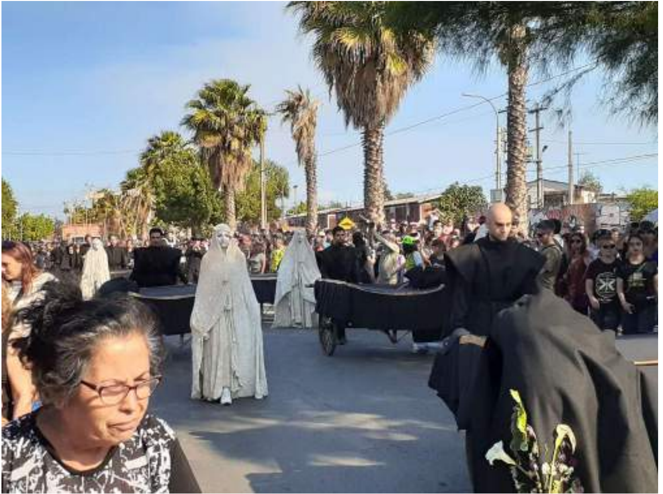
"Renca Despertó" - 2019