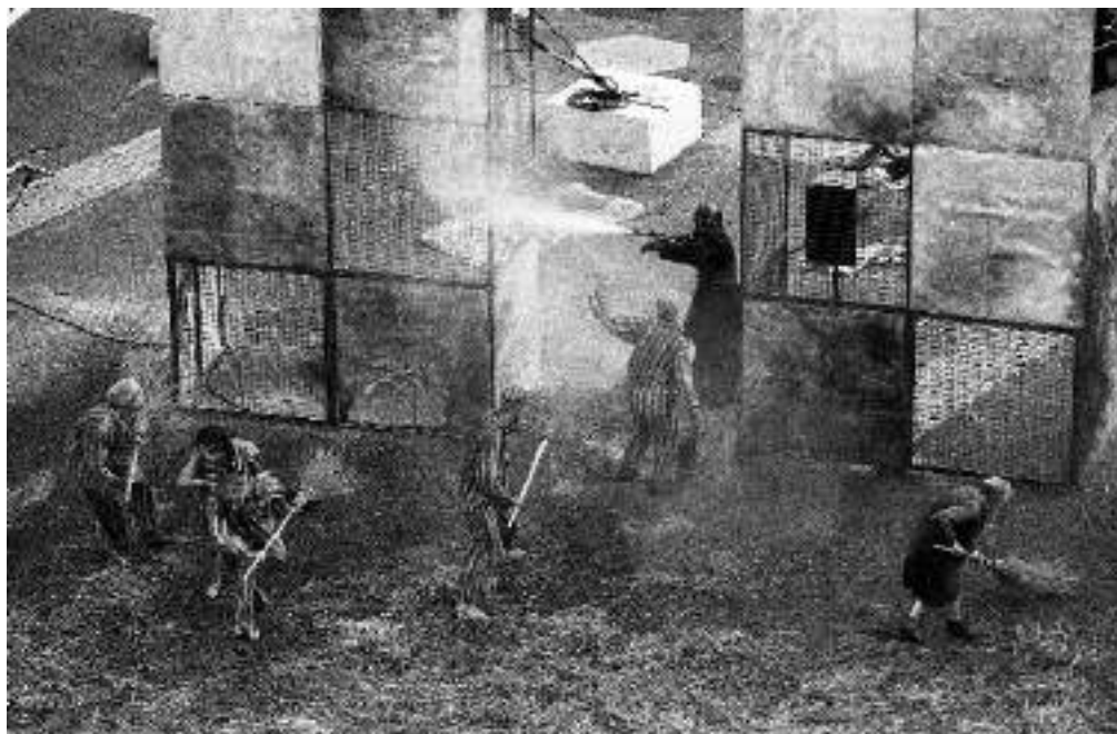
PURGATORIO - 2005

En 2005, el Teatro del Silencio en colaboración con Karlik Danza Teatro (España) crea la segunda parte del tríptico sobre Dante: « O Divina el commedia - Purgatorio - Una madre y sus hijos en el Purgatorio ». Inspirado en dos textos, " El Purgatorio " de Dante y " Madre Coraje " de Brecht. Una obra que interroga las guerras y sus negocios y las tragedias de los éxodos de nuestros días. « Purgatorio » será presentado del 2005 al 2008, en Irlanda, Francia, Bélgica, Dinamarca, España, Chile, Brasil, Colombia, Ecuador y Corea. Y el espectáculo será premiado en Irlanda y España.