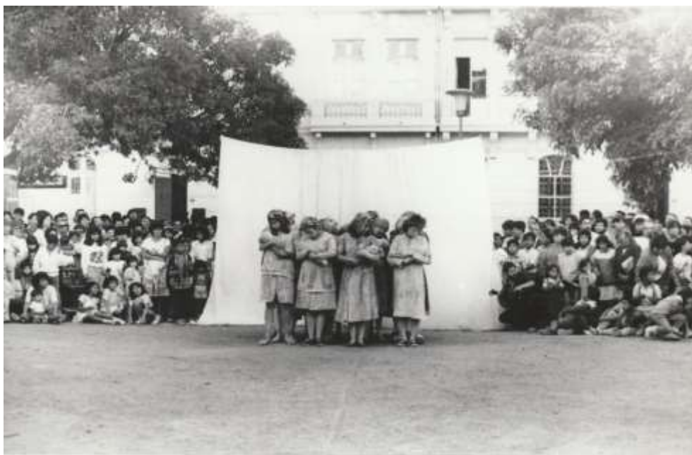
GARGANTÚA - Valparaíso - 1988

Esta trayectoria “formativa y laboral” durará diez años, a fines de los cuales regresa a Chile, en el momento de la transición hacia la democracia para fundar la Compañía Teatro del Silencio.