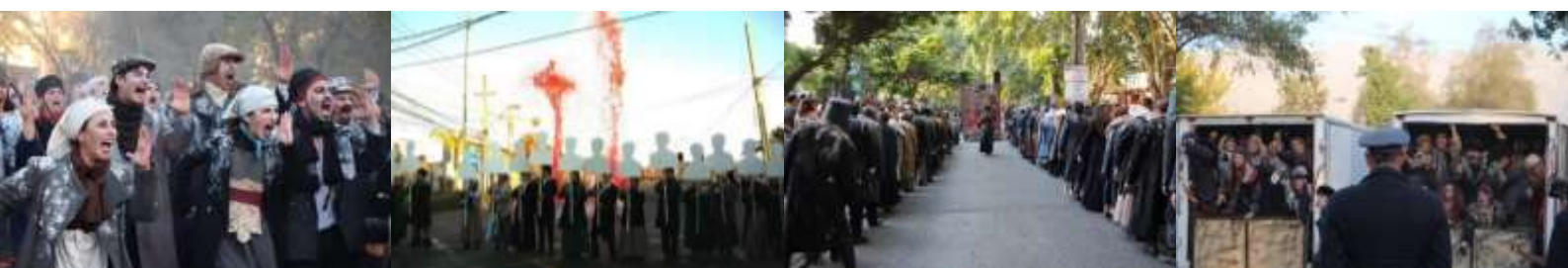
DOCTOR DAPERTUTTO – GIRA Chile 2016 © Fanny Enjalbert

En su tierra natal de origen, la Cía. realizara una intensa gira de 18 funciones - con gratuidad para el público - a través de 9 comunas de la RM en el marco de Santiago es Mío , con el apoyo del Gobierno. Regional Metropolitano, de la Dirección Regional Metropolitana del CNCA del Instituto Frances y de las comunas implicadas. Un intenso trabajo de sensibilización y capacitación realizando talleres con más 400 ciudadanos de todas edades y clases sociales, incluyendo sus participaciones al Itinerante de “ DOCTOR DAPERTUTTO ”, en Isla de Maipo, Conchalí, Quilicura, Lampa, Tiltil, San Bernardo, Macul, Pudahuel, Maipú.