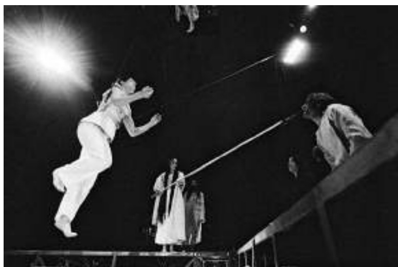
INFERNO - 2003

2003 es el año de una nueva creación de teatro-circo, « O Divina la Commedia - Inferno », inspirada en la obra de Dante y de otros textos como « La Cruzada de los Niños » de Marcel Schwob y el « Evangelio según San Mateo ». Comienza una búsqueda significativa de la intromisión del texto y la palabra asociada a un teatro físico gestual unido al circo aéreo.