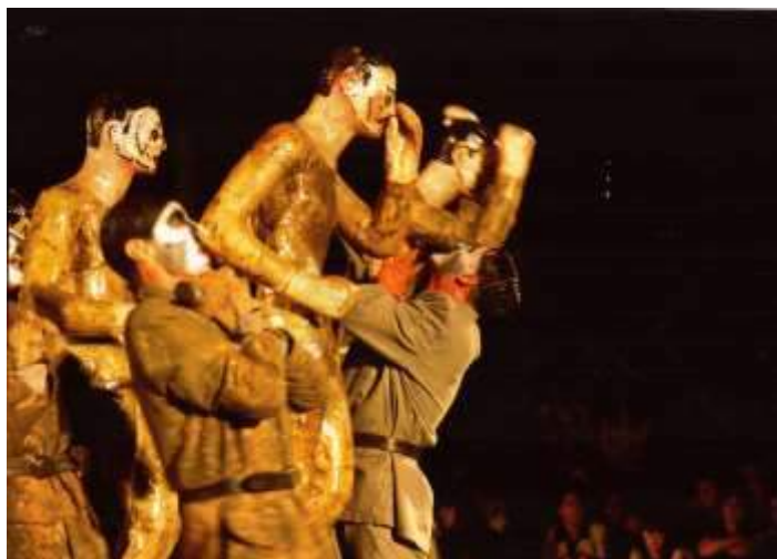
TACA TACA , Mon Amour - 1995

En 1993, fue elegido Teatro Itinerante por el Ministerio de Educación de Chile, el Teatro del Silencio crea « Taca Taca, mon amour » : que recorre la historia de la primera mitad del siglo XX, transpuesto en un taca-taca gigante. Presentada en Chile y distintos festivales Internacionales de América Latina y Europa hasta 1995. Una obra también ampliamente premiada por la críticos en Chile.