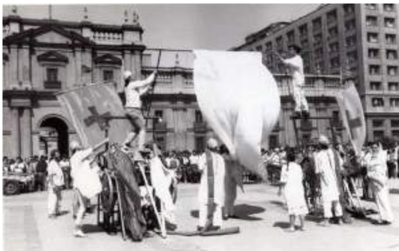
TRANSFUSIÓN – Montaje - Plaza de la Constitución – marzo 1990

En 32 años, la compañía ha presentado por el mundo más de 25 creaciones y cerca de 2000 funciones, la mayoría del tiempo gratuitamente para el público, a numerosos espectadores, a través de festivales, eventos artísticos y programaciones comunales en Chile, Argentina, Colombia, Venezuela, México, Brasil, Ecuador, Francia, Holanda, España, Bélgica, Alemania, Italia, Irlanda, Polonia, Suecia, Dinamarca, Túnez, Argelia, Canadá, Corea... para un público que oscila entre 300 y 8.000 espectadores según actuación : en calle, en carpa y escenarios.