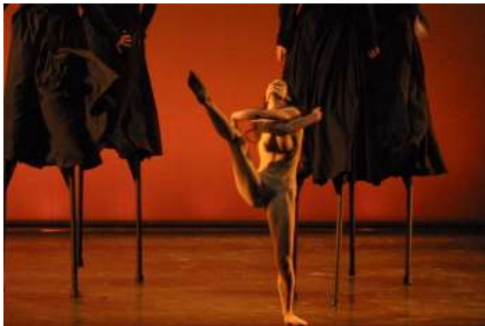
AMLOII como lo dijo Hamlet - 2002

En 2002 crea « Amloii o como lo dijo Hamlet » una obra inspirada en Hamlet de Shakespeare, para las Compañías españolas Karlik Danza Teatro y Samarkanda Teatro . Sera su tercer montaje de Teatro-Circo, donde parte del elenco del Teatro del Silencio, participa y se forma en disciplinas aéreas de los bailarines y actores de los elencos españoles como para la creación del vestuario y la composición musical y con las coreografías de Cristina Días Silveira de Karlik Danza .