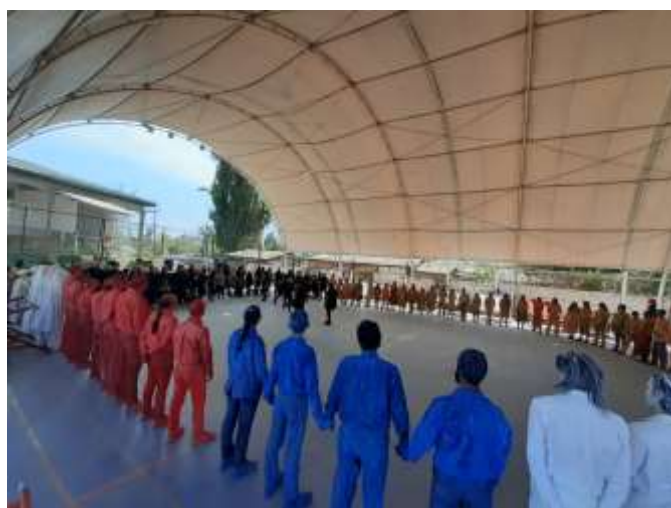
Preparación- Renca Despertó- 2019-

En 2019, se crea el pasacalle “ Renca Despertó ” en homenaje a los fallecidos en el incendio de la Fabrica Kayser de Renca, realizado en complicidad con la Cía. La Patriótico Interesante y cien artistas locales.