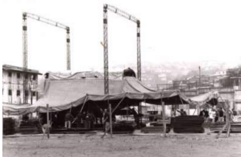
ALICE UNDERGROUND - Temporada gratuita para el público - Montaje carpa Teatro del Silencio en el Patio de la Ex Cárcel de Valparaíso - 1999

Esta obra fue programada en carpa de circo, por múltiples ciudades y festivales en Europa, hasta fin de 2002 y en Chile en 2001, en lugares emblemáticos como el Estadio Nacional de Santiago y en la Ex Cárcel de Valparaíso, gratuitamente para el público, gracias al apoyo de los Ministerios de Relaciones Exteriores de ambos países, Dirac y AFAA.