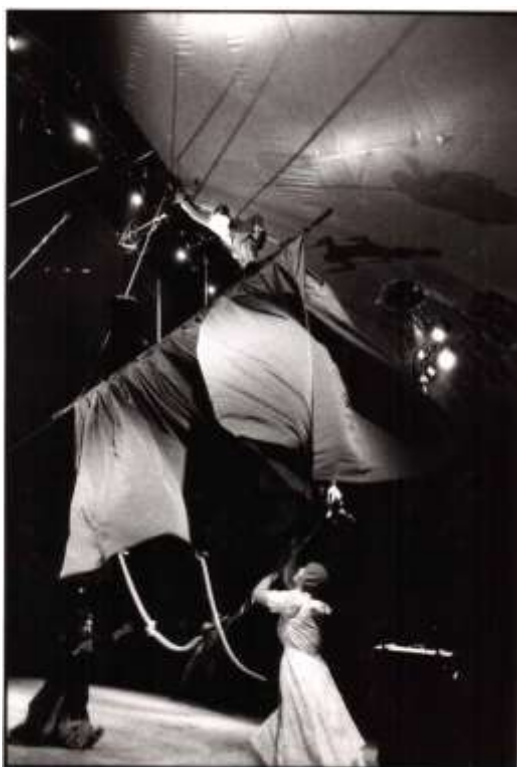
CANDIDES - 1995

En 1995, Mauricio Celedón realiza la puesta en escena de “ Candides ” (interpretación libre del famoso texto del autor francés: Voltaire) para la compañía francesa Cirque Baroque , que girara durante varios años por el mundo. Una obra que marcó un hito, e impulso el nacimiento del circo contemporáneo en Francia.