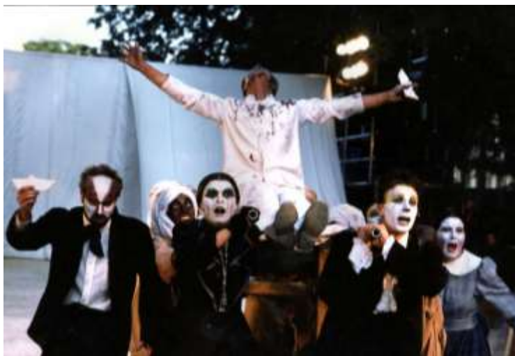
MALASANGRE O LAS MIL Y UNAS NOCHES DEL POETA - 1991 - © Michel Delon

« Malasangre o las Mil y unas noches del Poeta », un espectáculo inspirado en la vida del poeta francés Arthur Rimbaud, que ha sido presentado ante más de cien mil espectadores en Chile y que giró varios años, en destacados festivales de América, Europa y África del Norte hasta 1994. « Malasangre » será premiado y elogiado en varias ocasiones por la crítica chilena.