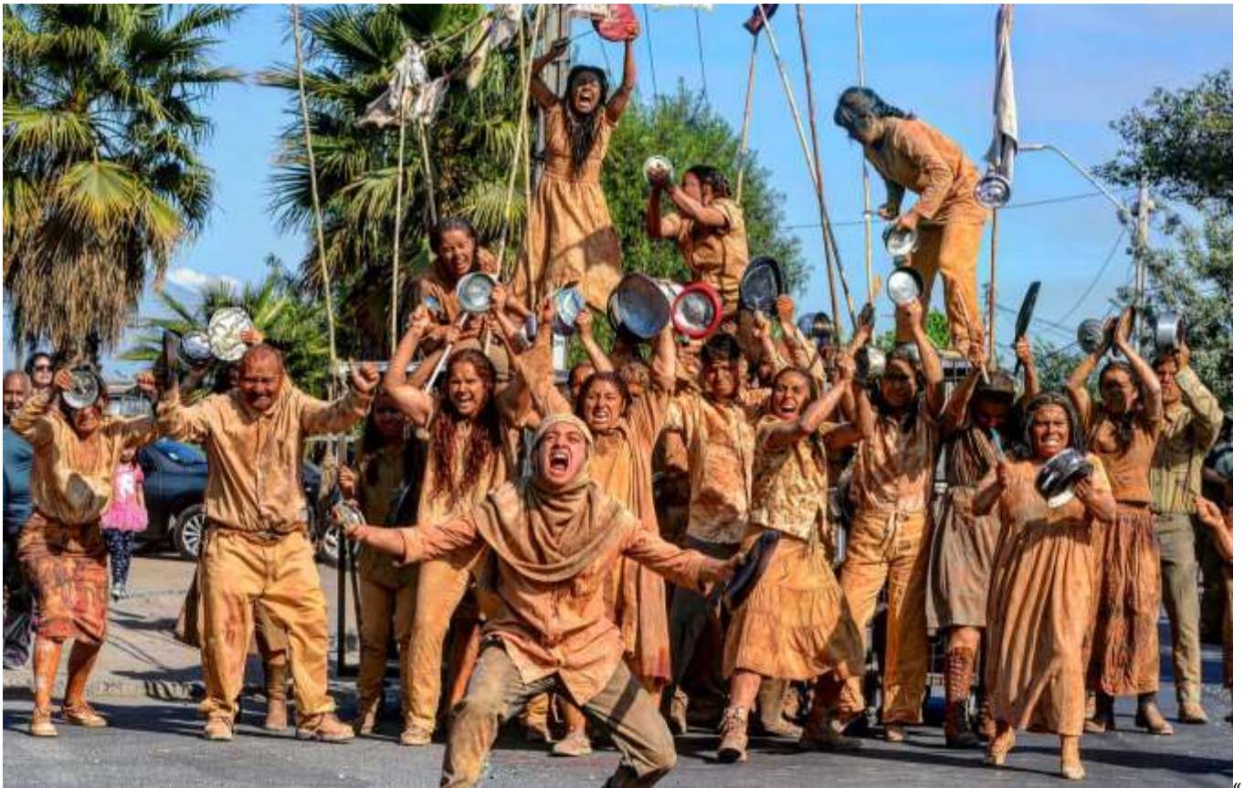
"Renca Despertó" - 2019