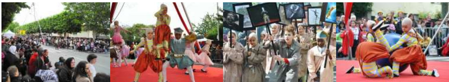
Musée du Bout du Monde -2011

Finalmente 2010 es para la Compañía un año de transición ya que inicia un nuevo período de residencia y de implantación en otra región: la Ile-de-France, ("Región Metropolitana de Paris") en la comuna de Aulnay-sous-Bois, con el Théâtre Jacques Prévert; donde entre 2010 y 2013, la Compañía crea « Emma DARWIN » y dos espectáculos de teatro musical: « L'île du temps perdu » y un homenaje al poeta cantante francés « Jean Ferrat », en la sala del Théâtre Jacques Prévert. Además, cada verano, el Teatro del Silencio monta su carpa de circo en la comuna, proponiendo talleres de circo para niños y adolescentes, workshops y laboratorios para profesionales y también presentando espectáculos de circo creados durante esas residencias circenses de verano.