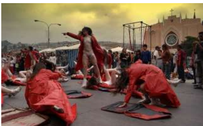
Intervención 24h - Valparaíso de la Madrugada al Amanecer - 2008

En 2007, el Teatro del Silencio termina su Tríptico con: « O Divina Commedia - Paraíso ». Inspirado en textos de Dante, Sarah Kane y Violeta Parra, « Paraíso ». interroga la sociedad del consumo capitalista. Un espectáculo para la calle y sala, que ha sido presentado entre 2007-2009, en Francia, Alemania, Polonia y Chile. En Diciembre 2018, con estudiantes de talleres que se realizaron en Valparaíso y poetas, pintores y artistas de la escena nacional, la Cía. realiza en el puerto una intervención urbana de 24hrs: « Valparaíso: De la Madrugada al Amanecer » con el apoyo del gobierno chileno.