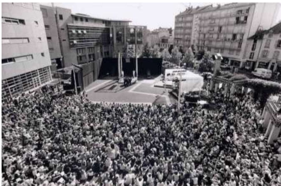
NANAQUI - Festival d'Aurillac 1998 - © Ch. Raynaud de Lage

En 1997, el Teatro del Silencio crea « Nanaqui- Dossier N° 262 602 – El Hombre que se dice Poeta », una pantomima de rock y de furor, un espectáculo de circo-teatro dedicado a Antonin Artaud, que después de su estreno en Valparaíso, viajara a Europa hasta fines de 1998, y realizará temporada de un mes y medio en Paris, en el destacado Espacio Circo del Parque de La Villette.