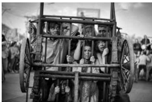
Taller e intervención - Los Migrantes- Renca - 2018-

Esas residencias en Renca permitieron realizar en 2018, un taller (Teatro gestual-Música-Vestuario) con 100 participantes finalizado con la intervención callejera « Los Migrantes » y un Encuentro de Arte y Cultura, con grandes poetas renquinos y nacionales como Raúl Zurita, Carmen Berenguer y el sociólogo, Tomás Moulian.