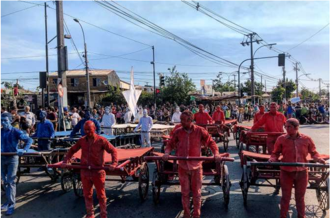
«Renca Despertó» - 2019